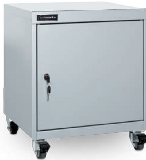
Fig.: Caisson 1 porte sur roulettes