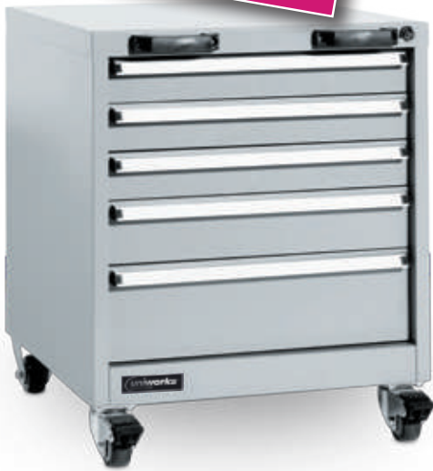
Fig.: Caisson 5 tiroirs sur roulettes